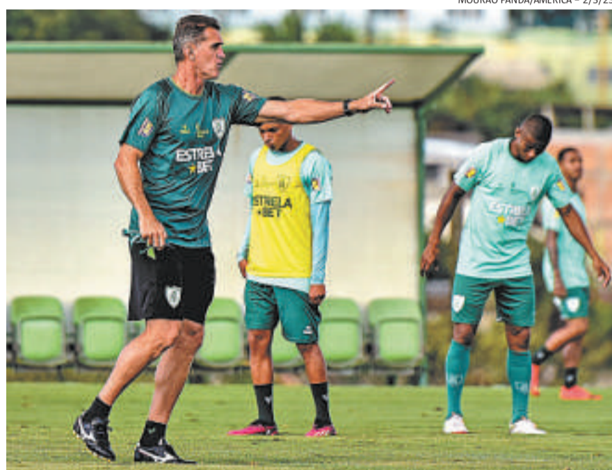
2/3/23